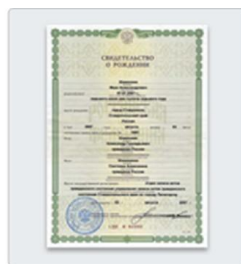
Свидетельство о рождении ребенка