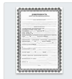
Если вы не родитель — доверенность или другой документ, подтверждающий право предоставлять интересы ребенка