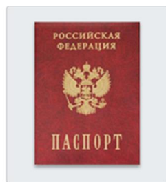
Страница паспорта с данными о регистрации родителя или свидетельство о временной регистрации